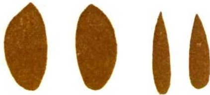
Crivello sotto 34