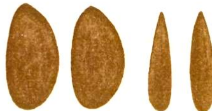
Crivello 36 bis - 37