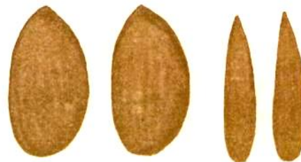
Crivello 37-37 bis